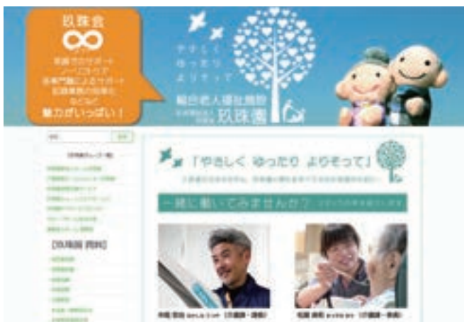
ホームページトップ画面